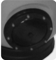
■ Manhole 200mm ■ Boca de hombre 200mm