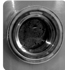
■ Optional sight glass ■ Mirilla opcional