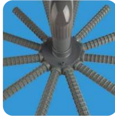
■ Fitted with 1" collector arms ■ Equipado con brazos colectores de 1"