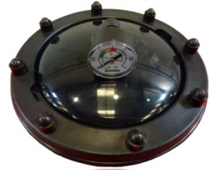
■ Black top lid with screws ■ Tapa tornillos negra