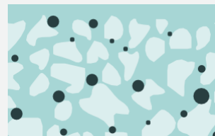
Фильтр с наполнителем Crystal Clear