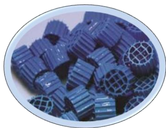
■ ОС-1 фильтрат