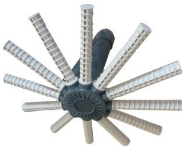
■ Оснащен коллекторами 1". Ответвления с открытой линией 3 мм

Не подходит для песка, стекла и других типов материалов