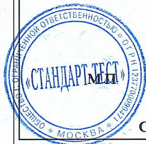
Схема сертификации: 1с. Срок годности не ограничен.

Условия хранения: в сухом отапливаемом помещении. Пластиковое ведро из PP.