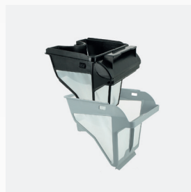
Корзина фильтра Двухступенчатый фильтр: 150/60 мкм